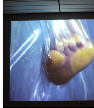
Modelle des Überlebens: Ideen von lustig bis beklemmend, zum Unterschlupfen, Überziehen, in natura und Projektion, Miniatur und ... überlebensgroß. Zu den Werken siehe: